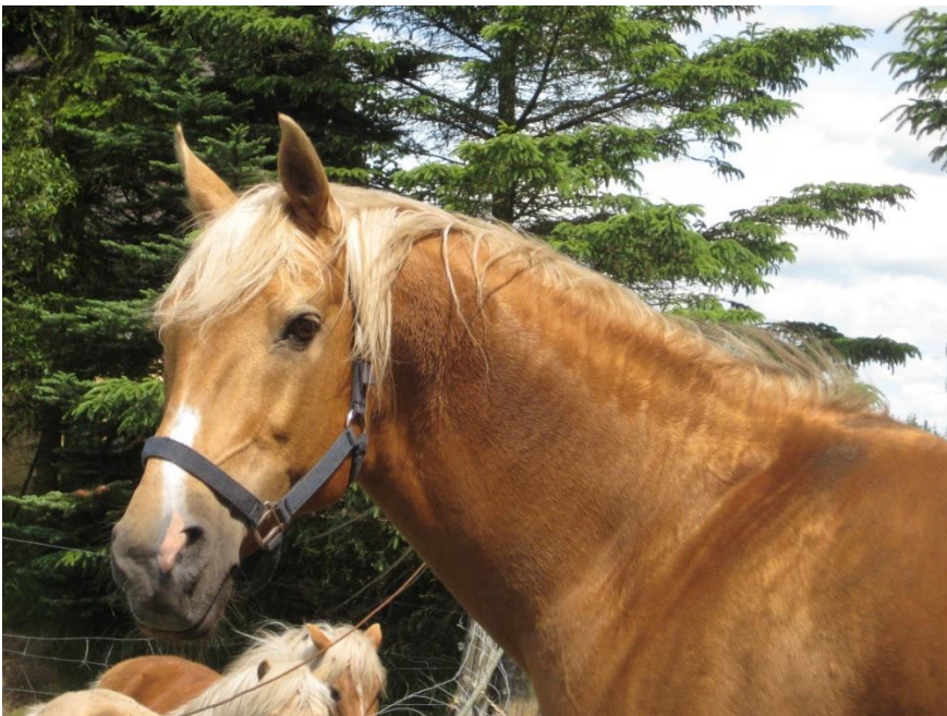
Hingsten Stargolds Cavalero

Moderforbundet British Palomino Society - BPS, avlsprogram indeholder alle 3 grundfarver, derfor udvider PSA nu også, fra 2023, avlsprogrammet, så der er et avlsprogram for Palomino, et for Buskskin og et for Smokey black farvede heste.